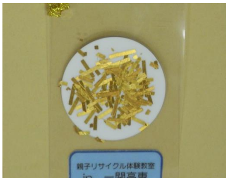
電子基板から取り出した金泊